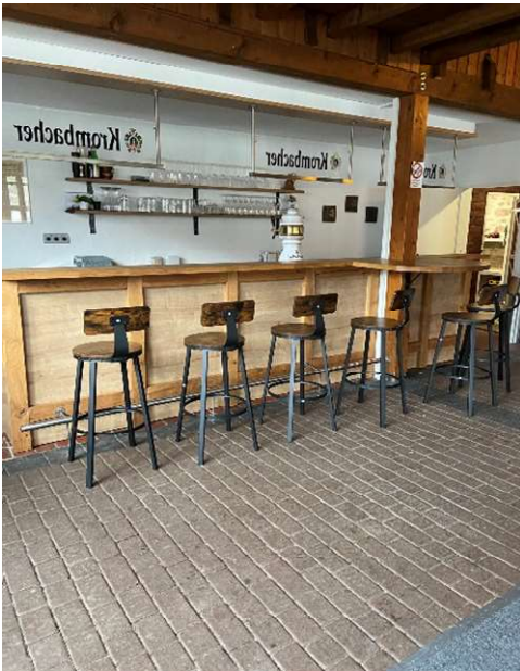
Die schöne Theke im Pavillon jetzt mit neuen Barhockern