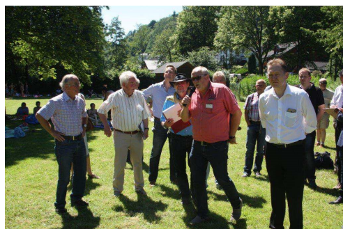
Foto vom Rundgang der Stadt-Kommission 2016 im Naturbad Veischedetal