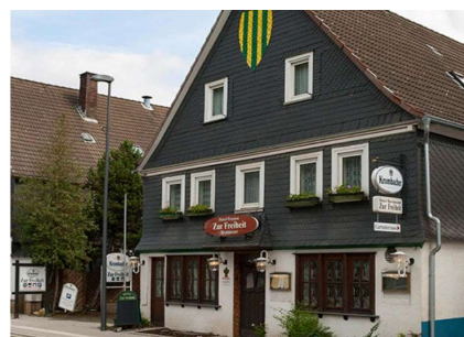
Hotel "zur Freiheit"

Aus gesundheitlichen Gründen musste Dieter Strohmeyer nach 33 Jahren als Gastronom in Bilstein seine Tätigkeit beenden. Wir wünschen „Alles Gute“!